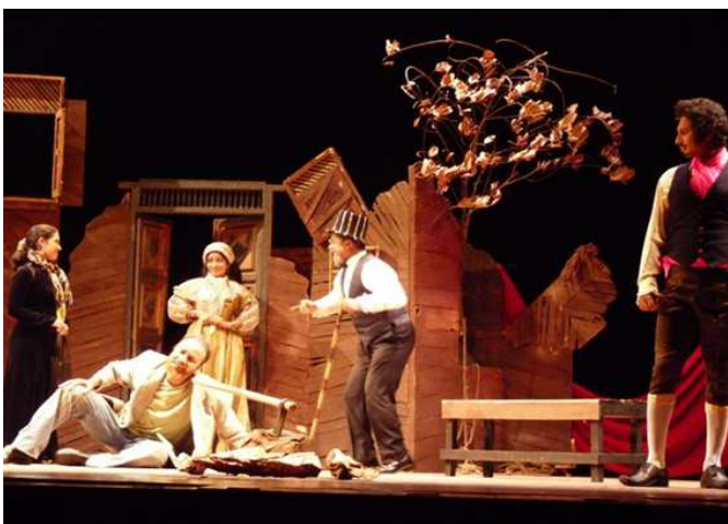
▲ Représentation théâtrale