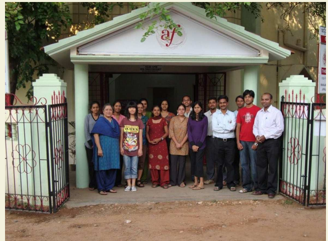
L'équipe de l'Alliance française à Mysore

Une annexe de l'Alliance française de Bangalore vient de voir le jour, à 160 km au sud-ouest de la capitale du Karnataka, dans la ville royale de Mysore que tous les touristes qui sillonnent le sud de l'Inde connaissent bien, particulièrement pour son magnifique palais et ses monuments historiques.