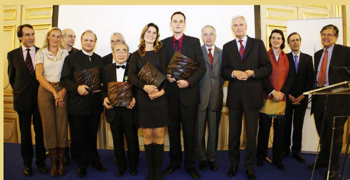
Les lauréats et le jury à la remise de prix au Quai d'Orsay