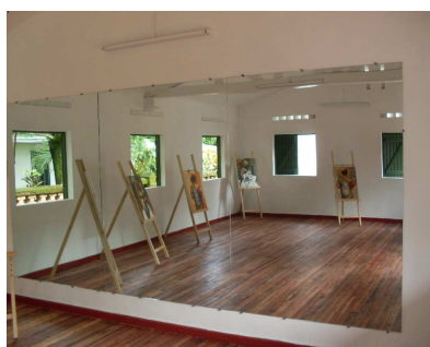
◀ Centre d'enseignement artistique ▶