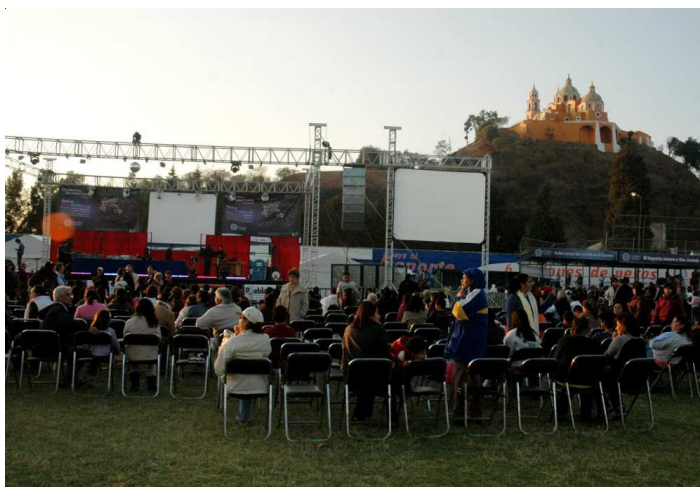
▲ Nuit des étoiles à Cholula (Puebla)