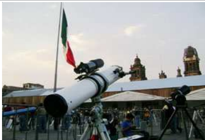
▲ Nuit des étoiles à Mexico