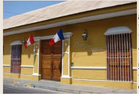
Façade Alliance française de Piura

Le 2 avril dernier, l'Alliance française de Piura, par une cérémonie officielle en présence de l'ambassadeur de France au Pérou et d'une délégation composée du conseiller culturel