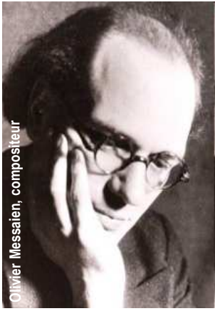
Olivier Messiaen, compositeur