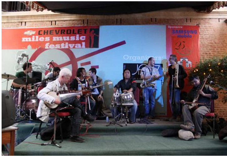
▲ Le groupe Ozma

► Le groupe de Jazz OZMA, qui a remporté le festival de Jazz de la Défense à Paris en 2006, et a été élu la même année meilleur groupe de Jazz français a donné un concert exceptionnel à l'Alliance française de Katmandou.