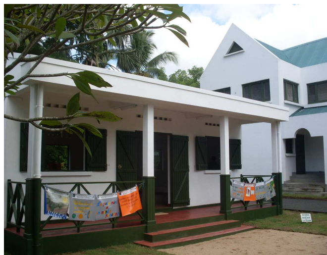
Alliance française de Tamatave

· Par le passé, l'Alliance française avait tenté l'ouverture de quelques cours d'éveil artistique, mais n'avait pas suffisamment investi dans